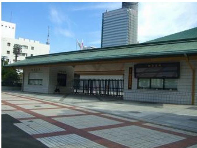
新国技館正面入口