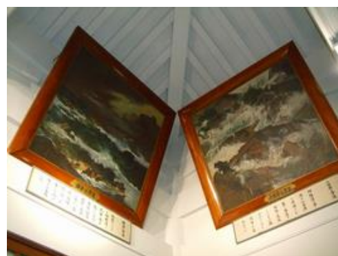
鎌倉の津波・小田原の津波の絵