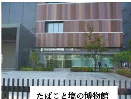
たばこと塩の博物館