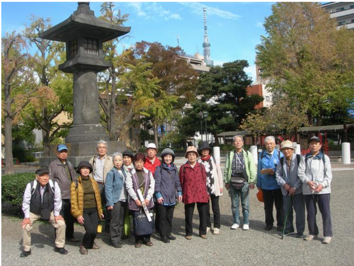
東京都慰霊堂で集合写真