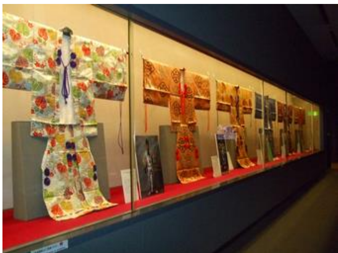
相撲博物館には立行司の衣装が沢山飾られている