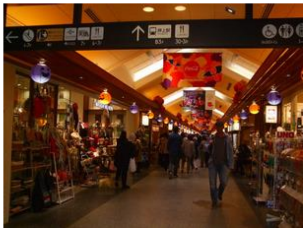
ソラマチに向かう途中のスカイツリーとソラマチの中