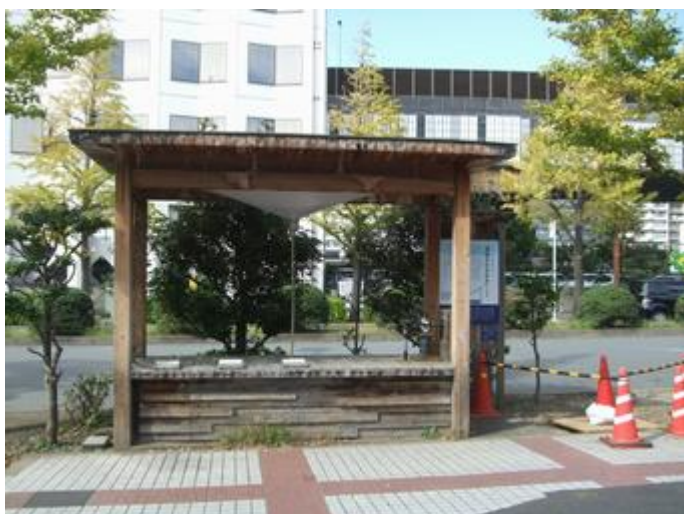
国技館前のさかさかさ【逆さ傘】コンクリートやアスファルトの東京の町にも、天からの恵みの雨水をもっと大切にと、逆三角屋根にためた雨水は付近の花壇の水やりなどに活用します。