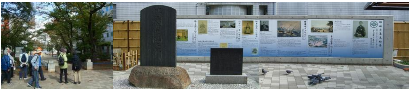
勝海舟生誕地の両国公園