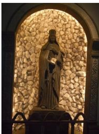
塩で作られた聖母