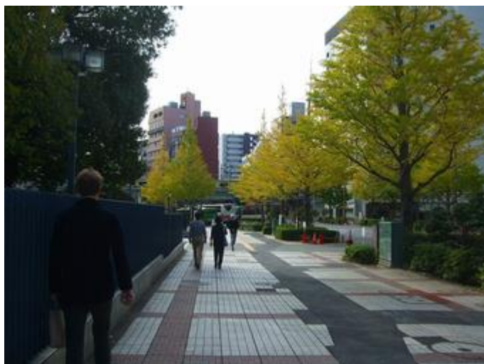
博物館前、両国駅に向かう通り