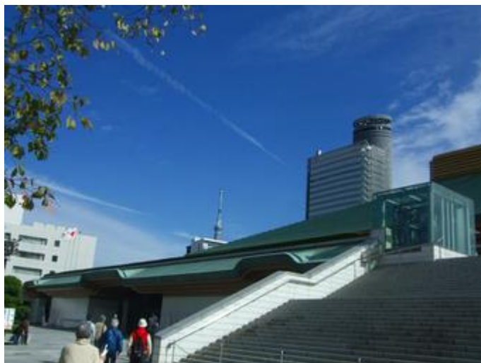
国技館の隣に相撲博物館