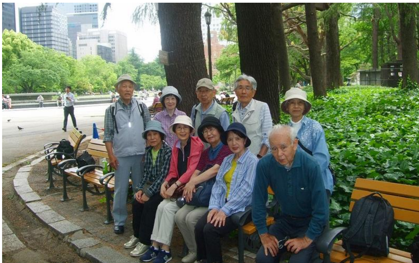
日比谷公園、参加者 16 名でしたが近くにいた方数名で記念写真