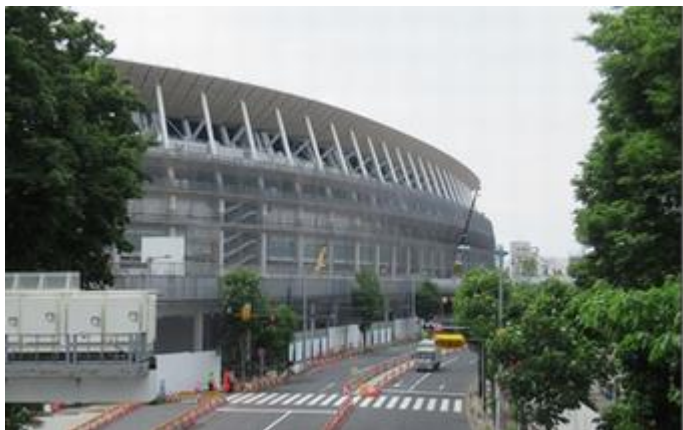
工事中的新国立競技場