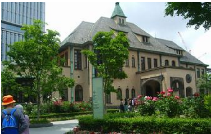
赤坂プリンスホテル